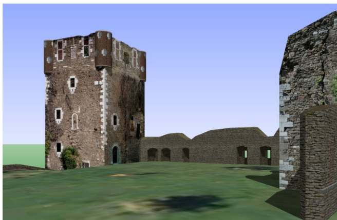
Le vieux château au niveau de la haute-cour

Heureusement, il existe beaucoup d'autres possibilités bien plus ludiques et appréciées des amateurs de belles choses. Une de celles-ci est de participer à la concrétisation d'une idée un peu folle qui consiste à modéliser la planète entière. Ce projet, c'est l'entreprise Google™ qui l'a développé dès 2004 en rachetant la société Keyhole (à la base du concept). Il sera baptisé Google Earth™ en 2005 ( Vous trouverez tous les liens en fin d'article ).