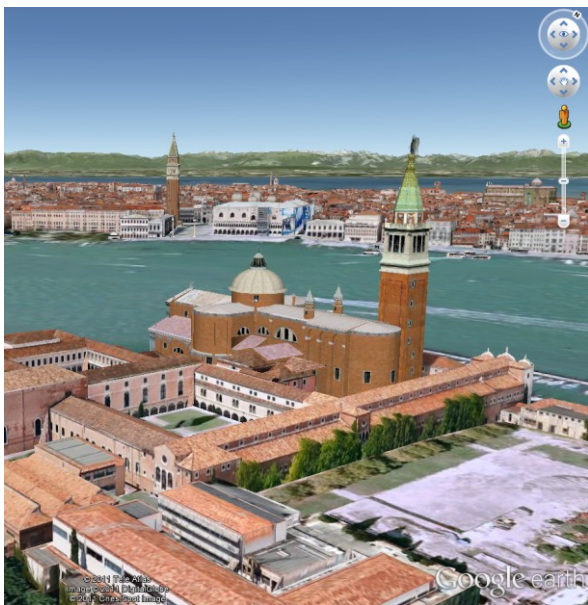
Petit exemple de rendu 3D

En matière de communication, il est toujours utile de suivre l'évolution des techniques et notre époque est des plus agitées dans ce domaine.