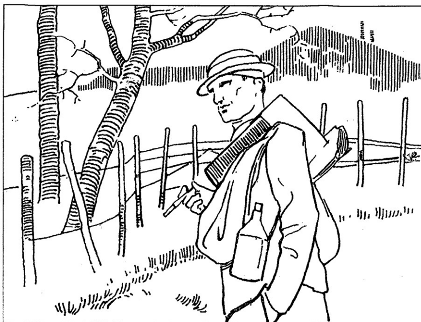
Dessin d'Auguste Donnay montrant le retour du mineur muni de son casque, de son bidon et de sa hêpe (hache).

Pendant de longues années, le charbon est resté notre principale source d'énergie, mais le déclin a commencé vers la fin des années soixante, où l'on s'est tourné toujours plus vers le pétrole.