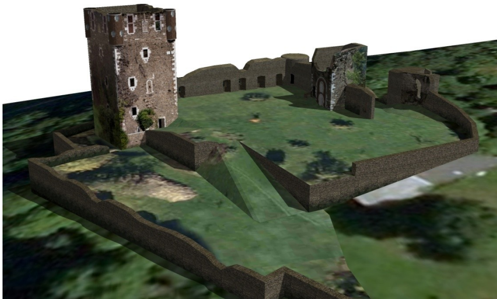
Le modèle habillé de photos ou textures (remparts)